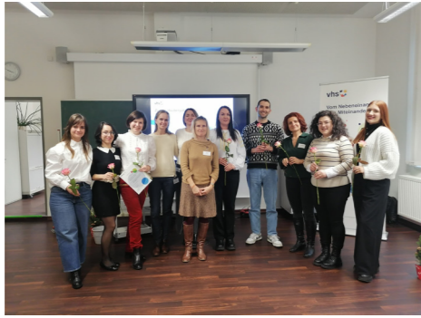
EPQmigra Abschlusskonferenz in der kvhs Hildburghausen 2024

Im Projekt „Vom Nebeneinander zum Miteinander“ schlossen 18 neue Lehrkräfte das Qualifizierungsangebot EPQmigra erfolgreich ab.