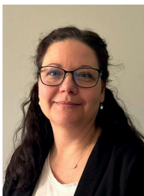
© Bildungswerk der Thüringer Wirtschaft e.V.

habens im Rahmen der Nationalen Dekade für Alphabetisierung und Grundbildung.