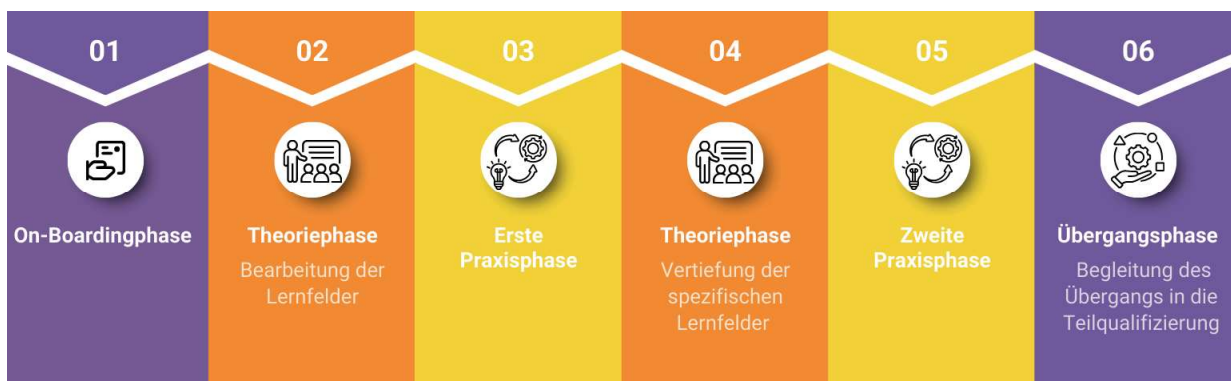
Ablaufplan 1. Vorbereitungskurs. Abbildung: Projekt „Zukunftswege“

Viele Teilnehmende bewegen sich in komplexen Lebenslagen. Lernprozesse sind daher eng mit sozialen, gesund-