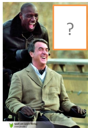
Ziemlich beste Freunde