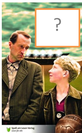
Das Wunder von Bern

ZiemlichbesteFreundeDasWundervonBernRomeoundJuliaDasPhantomderOper